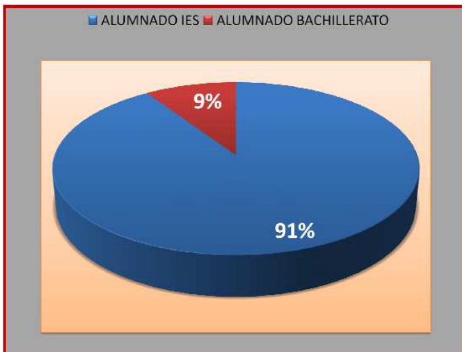
Figura 2. • Porcentaje global de alumnos matriculados en este bachillerato en relación con el número global de alumnos de todos los centros participantes